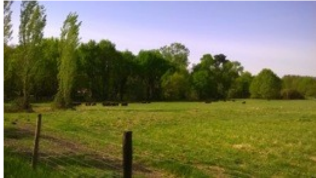
Photo 6. Échanges autour de l'environnement spatial : la proximité du semi-rural.

Les méthodes visuelles sont aussi utilisées pour favoriser l'expression directe des enquêtés. En collaboration avec les enseignants et, parfois, avec des artistes intervenant en classe, nous favorisons la réalisation de productions visuelles par les élèves eux-mêmes. L'enquêteur peut ainsi entrer en dialogue avec l'enquêté dès les premières phases de la réalisation de l'œuvre, au fur et à mesure de la progression et jusqu'à la finalisation. Les photos 7, 8 et 9 montrent la réalisation de boîtes à souvenir décorées par les élèves d'UPE2A d'une école élémentaire de l'agglomération bordelaise. La consigne était de raconter un moment de leur vie dans le pays d'origine. Ces productions ont servi de support dans la phase d'entretien sur le thème de la migration, puis à un projet d'émission de radio réalisé en collaboration avec les élèves de CM2 de la classe ordinaire d'un enseignant de la même école.