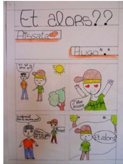
Photos 10 et 11. Travail d'écriture d'un scénario de bande dessinée.