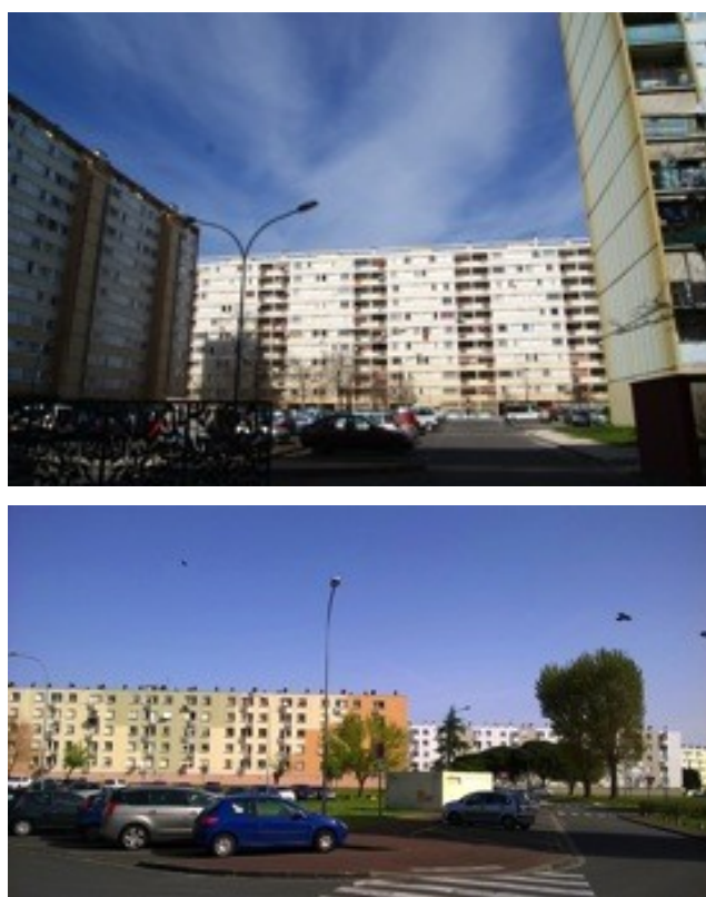
Photo 4 et 5. Échanges autour de l'environnement spatial : la cité.