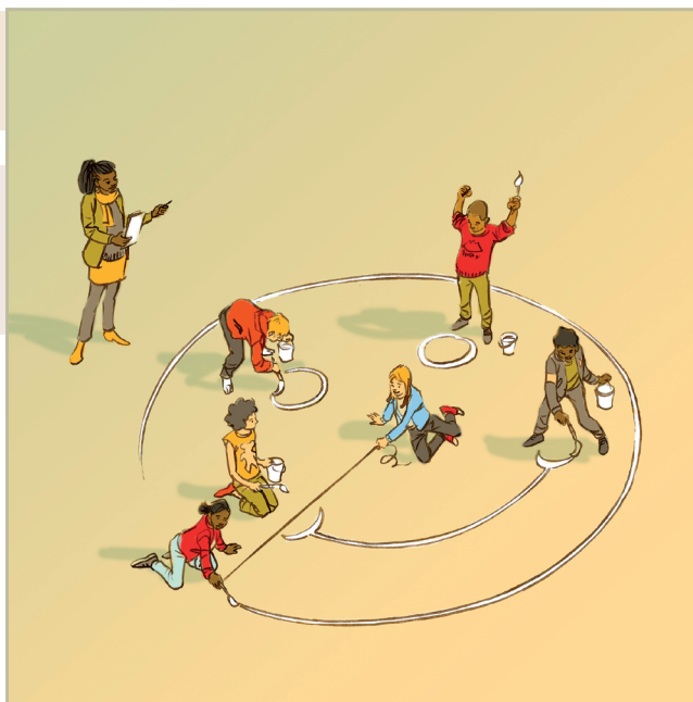
Illustration de couverture: Jean-Luc Boiré Illustrations intérieures: James